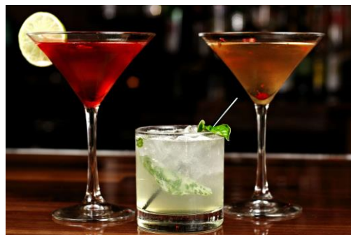
Food & Beverage (convenzionale e bio)