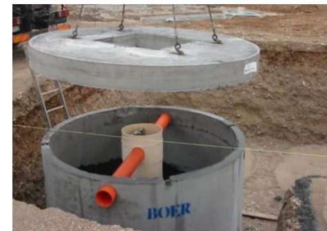
Depurazione e trattamento acque