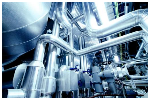
Macchine e impianti industriali